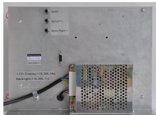
Abbildung 1: Geräterückseite

Auf der Geräterückseite (siehe Abbildung 1) sind neben dem Netzteil und der 9-poligen Buchse für den Anschluss des Videosignals drei Tasten angebracht.