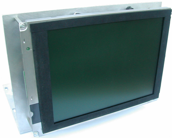
Abbildung 2: Gerätevorderseite

Das Gerät besteht aus einer L-förmigen Platte, auf die der TFT-Schirm, die Controllerplatine, der Converter für die Hintergrundbeleuchtung sowie das Netzteil montiert sind (siehe Abbildung 1 und Abbildung 2).