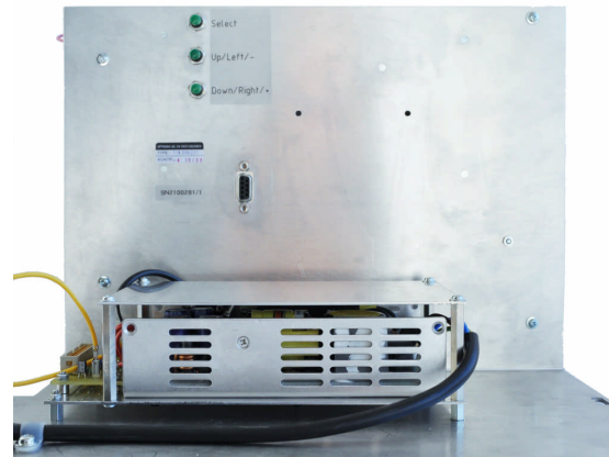
Abbildung 2: Geräterückseite

Auf der Geräterückseite (siehe Abbildung 2) sind neben dem Netzteil und der 9-poligen Buchse für den Anschluss des Videosignals drei Tasten angebracht.