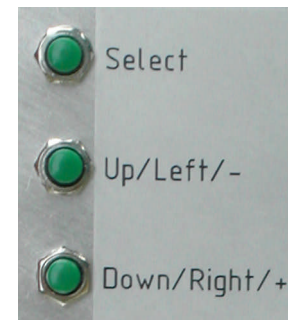
Abbildung 4: Tasten auf Geräterückseite