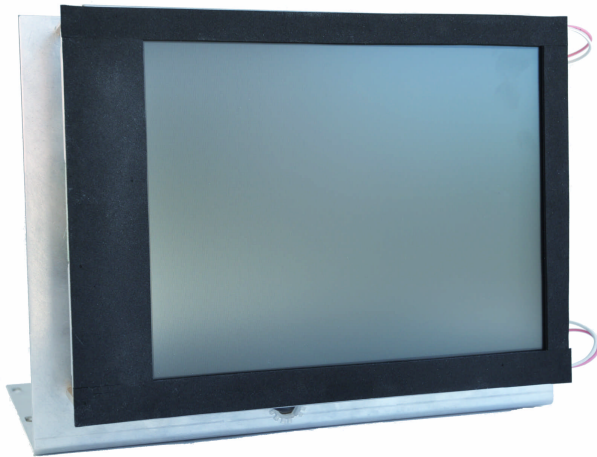
Abbildung 1: Gerätevorderseite

Das Gerät besteht aus einer L-förmigen Platte, auf die der TFT-Schirm, die Controllerplatine, der Converter für die Hintergrundbeleuchtung sowie das Netzteil montiert sind (siehe Abbildung 2 und Abbildung 1).